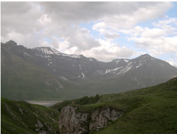
Cresta Roncia -Lamet

Per avere maggiori informazioni o se volete farvi accompagnare nell'ascensione : www.altox.it