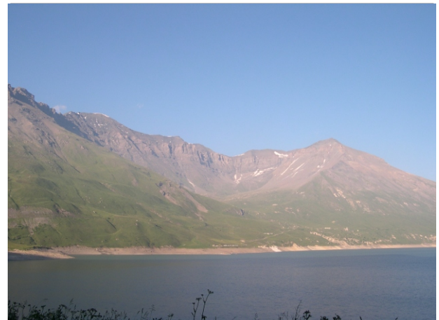
Roncia -Lamet dal lago del Monceniso