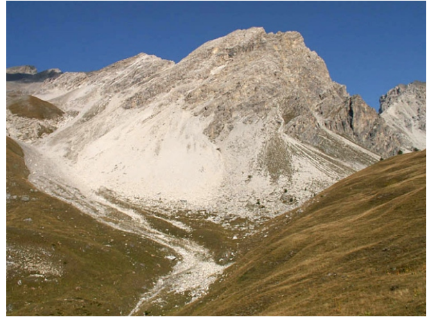
Rocca del Lago versante Fenils