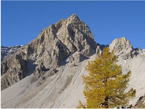
Rocca del Lago dal versante Desertes