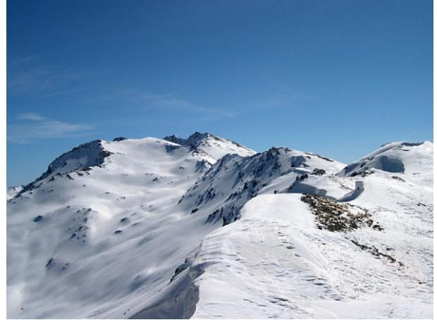
Terra Nera dalla cima Dormillouse