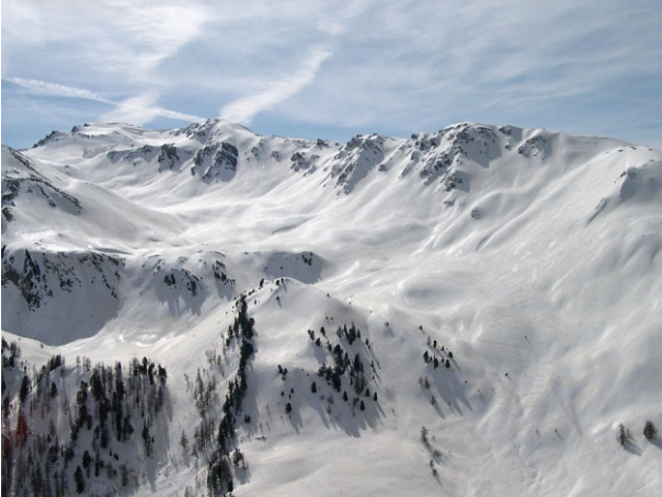
Vallone della Dormillouse

Per avere maggiori informazioni o se volete farvi accompagnare nell'ascensione : www.altox.it